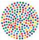
Application ILO Events

L’application ILO Events est téléchargeable dans l’une des boutiques (App Store pour les appareils fonctionnant sous iOS ou Google Play pour les appareils fonctionnant sous Android). Il suffit de lancer une recherche avec l’appellation «ILO Events».