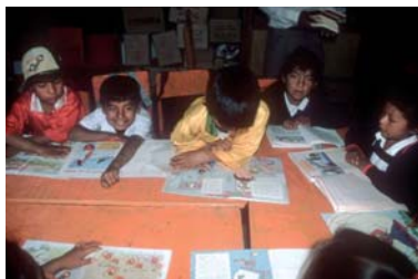
Ученики местной школы читают книги, приобретенные для них МОТ. Моллехуака, Перу

от эксплуатации и жестокого обращения. Они отстаивают право работников на удовлетворительное вознаграждение, тем самым уменьшая зависимость малообеспеченных семей от труда своих детей. В дополнение к ведению переговоров от лица своих взрослых членов организации работников могут прилагать дополнительные усилия к тому, чтобы дети не работали, а учились. Существующее в структуре МОТ Бюро по деятельности работодателей осуществляет гендерно-чувствительную программу технического содействия, финансируемую правительством Норвегии и направленную на наращивание потенциала работодателей и их организаций в области борьбы с детским трудом 11 .