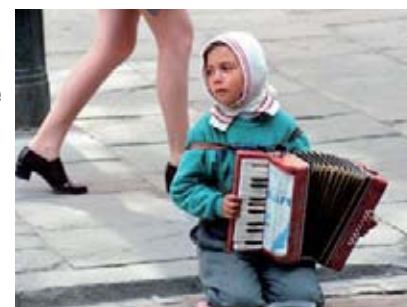
Юный музыкант просит милостыню в Варшаве. Польша

По сравнению с мальчиками девочки, т. е. добрая половина всех детей в мире, являются менее защищенными. На международном уровне растет признание того факта, что образование девочек – один из самых мощных инструментов прогресса. Однако когда речь заходит