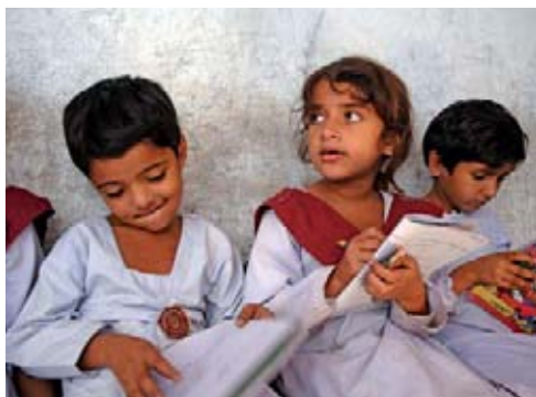
Начальная школа, открытая при участии Международной программы МОТ по искоренению детского труда (ИПЕК). Сиалкот, Пакистан

о получении доступа к образованию, девочки подвергаются дискриминации. Во Всемирном докладе по мониторингу образования для всех за 2007 год отмечено, что из 72 млн детей младшего школьного возраста, не охваченных школьным образованием, 44 млн – девочки. Однако отдавать предпочтение мальчикам перед девочками в данной сфере неразумно. Как показывает опыт различных стран, образование девочек – один из наиболее эффективных способов борьбы с бедностью. Отсутствие образования для девочек обходится развивающимся странам в 92 млрд долларов США в год 4 . Образованные девочки, когда становятся взрослыми, обычно имеют более высокий доход, позже выходят замуж, рожают немного, но более здоровых детей и обладают большим авторитетом в семье. Важно и то, что они, в свою очередь, стараются дать образование собственным детям, не допуская тем самым распространения детского труда в будущем.