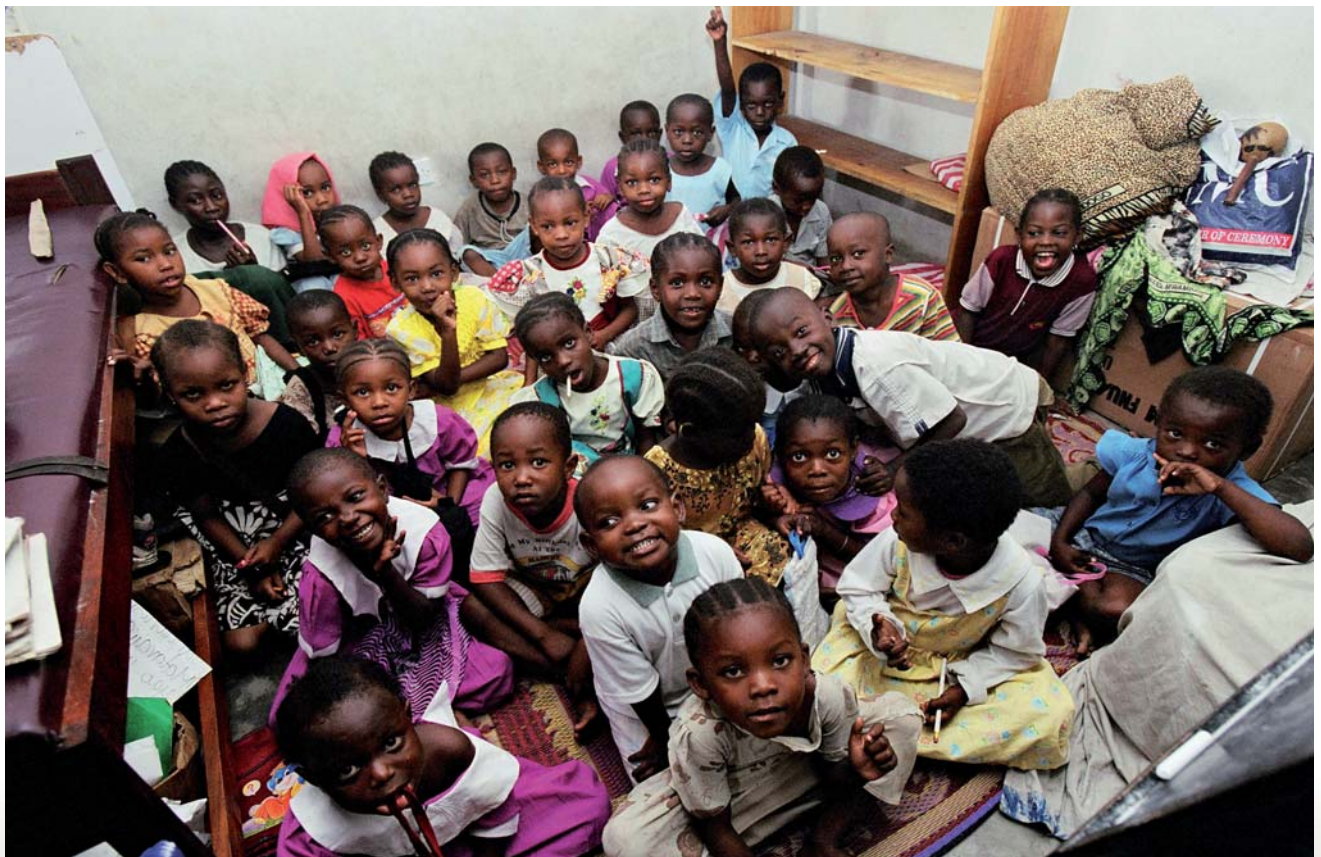
Начальная школа, открытая при участии Международной программы МОТ по искоренению детского труда (ИПЕК). Дар-эс-Салам, Объединенная Республика Танзания