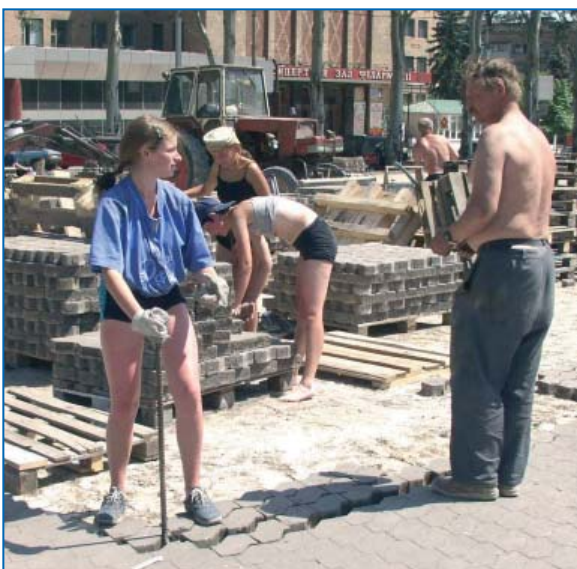
Дитяча праця на будівництві. Україна. 2008 Child labour at construction site. Ukraine. 2008

Відповідно до результатів дослідження за методом швидкого оцінювання МОП-ІПЕК у 2006 році, найгірші форми дитячої праці в Україні поширені у сільському господарстві, вуличній торгівлі, на неофіційних вугільних копальнях, в індустрії розваг (робота в барах та нічних клубах), секс-індустрії (проституція та порнографія) та в інших нелегальних видах діяльності. Головними причинами, що змушують батьків і дітей шукати шляхи збільшення доходів родини за рахунок дитячої праці, є безробіття, низький рівень заробітної плати та бідність. Якісне дослідження МОП-ІПЕК засвідчило, що батьки позитивно ставляться до дитячої праці, розглядаючи ранне працевлаштування як корисний досвід для соціального та особистісного розвитку дитини.