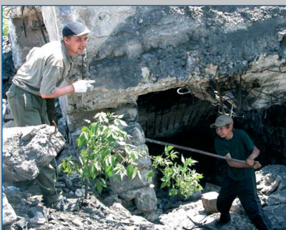
Дитяча праця біля нелегальної шахти, Україна 2008 Child labour near illegal mine, Ukraine 2008

The correlation between migration of parents and WFCL, including trafficking in children should be further studied. According to the available research, migration of parents negatively affects their children, in particular school attendance and quality of education. Some experts see the risk of those children to be involved in criminal activities and, in the long run, to become victims of trafficking 1 .