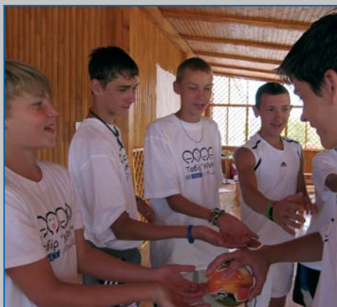
Літній табір за методикою «КРИК», Євпаторія, Україна 2008 SCREAM summer camp, Evpatoria, Ukraine 2008

• У 2008-2009 роках, діти-учасники проектів МОП ІПЕК у пілотних регіонах були залучені до процесу прийняття рішень та брали участь у засіданнях Місцевих комітетів дій, під час яких їх погляди на шляхи боротьби із дитячою працею були враховані. Бенефіціанти програми ІПЕК були залучені до підготовки щоквартальних бюлетнів, на сторінках яких діти висловлювали своє ставлення до заходів програми МОП ІПЕК у пілотних регіонах Донецької та Херсонської областей.