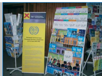
Публікації МОП-ІПЕК ILO-IPEC Publications

Для проведення тренінгів використовуються посібники, рекомендації та інші методичні матеріали, розроблені партнерами програми МОП-ІПЕК в Україні або перекладені та адаптовані до місцевих умов. Зокрема: