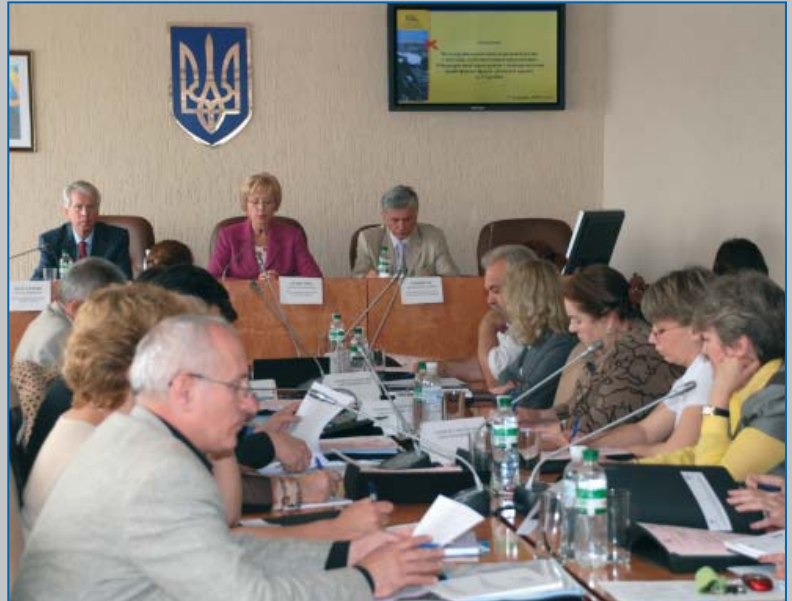
Засідання Всеукраїнської спостережної ради, 2008-2009 National Steering Committee meeting, 2008-2009

У червні 2002 року було підписано Меморандум про взаєморозуміння між Міжнародною організацією праці, в особі Міжнародної програми з викоренення дитячої праці, та Урядом України. Відповідно до Меморандуму було сформовано Всеукраїнську спостережну раду (ВСР) під егідою Міністерства праці та соціальної політики України, а Міністра призначено Головою Ради. Діяльність Програми МОП-ІПЕК, основні заходи та стратегічні напрямки узгоджуються та затверджуються національними партнерами МОП в рамках регулярних засідань ВСР. В грудні 2008 року до Меморандуму було внесено зміни та продовжено його дію на наступні 5 років.