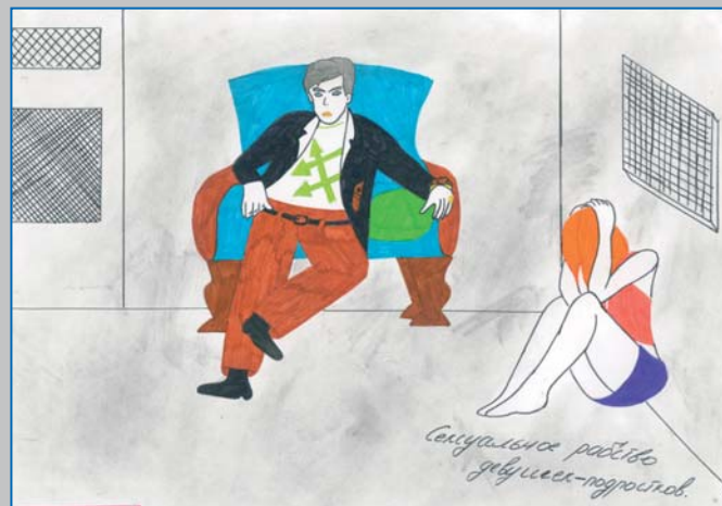
Малюнок учасниці конкурсу «Дитяча праця очима дітей», Херсон 2009 Drawing for the contest "Child Labour: Children Perspective", Kherson 2009

Недостатньо вивченою залишається проблема дітей трудових мігрантів. Зокрема, переважна більшість експертів звертає увагу на негативні наслідки для дітей виїзду батьків за кордон, залишивши їх без достатнього догляду. До найбільш помітних змін у поведінці дитини після від'їзду батьків відносять пропуски занять без поважних причин, зниження успішності у навчанні, неслухняність. Через послаблення контролю з боку сім'ї, існує висока імовірність втягнення таких дітей до алкоголізму, наркоманії, бродяжництва та злочинної діяльності 1 .