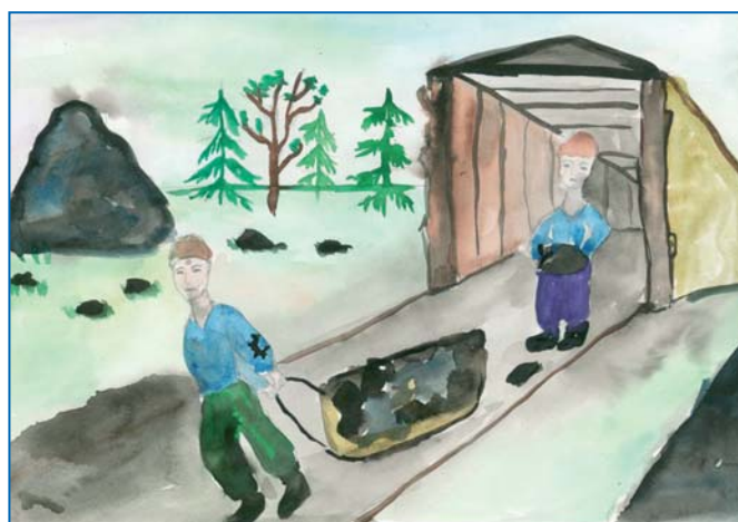
Малюнок учасниці конкурсу «Дитяча праця очима дітей», Донецьк 2009 Drawing for the contest "Child Labour: Children Perspective", Donetsk 2009