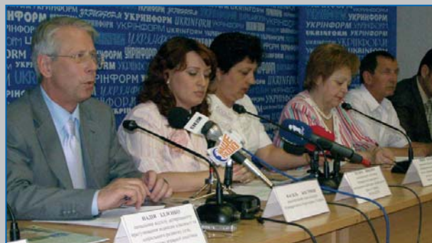
Прес-конференція «Врожай заради майбутнього: сільське господарство без дитячої праці», червень 2007, Київ Press conference "Harvest for the Future: Agriculture without Child Labour", June 2007, Kyiv

On June 8, 2007, a press conference was organized. During the conference, the OSH Inspection representative informed that one child died and nearly 15-16 were injured during the harvest time of 2006 in Ukraine. The OSH Inspection, as well as Labour Inspection, reported on the current actions undertaken by the State regarding inspection and control of the workplaces where children work and measures to protect these children.