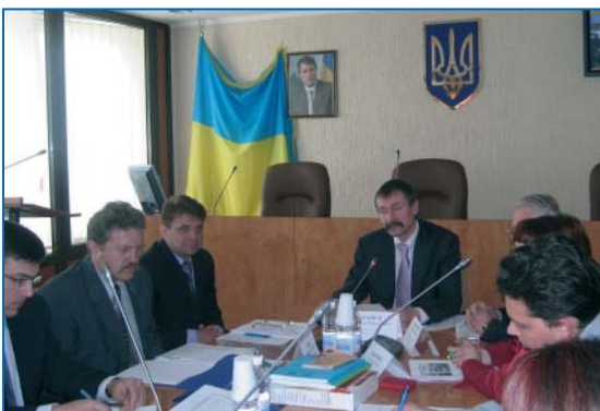
Засідання Всеукраїнської спостережної ради, 2007 National Steering Committee meeting, 2007

The Memorandum of Understanding between the International Labour Organization, represented by the International Programme on the Elimination of Child Labour, and the Ukrainian Government was signed in June 2002. Pursuant to the Memorandum, the National Steering Committee (NSC) was established under the auspices of the Ministry of Labour and Social Policy and the Minister acts as the NSC Chairperson. The ILO-IPEC priorities and strategies are agreed with and endorsed by the ILO national partners within regular NSC meetings. In December 2008, the Memorandum was amended and extended for the next 5 years.