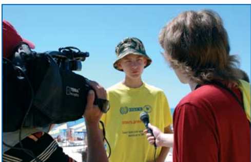
Інтерв'ю учасника літнього табору «КРИК», Херсонська область, 2008 Interview of SCREAM summer camp participant, Kherson region, 2008

На основі посібника для журналістів, підготовленого в межах проекту ІПЕК, Програма МОП-ІПЕК в Україні провела навчання 30 журналістів з питань дитячої праці та методики проведення журналістських розслідувань. За результатами навчання було опубліковано та вийшло в ефір 20 газетних/журнальних/радіо/телевізійних репортажів про дитячу працю,