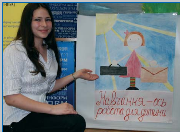
Плакат «Навчання – ось робота для дитини», перше місце на конкурсі плакатів, Київ 2009 Poster "Education is the Right Job for a Child", 1st place, poster competition, Kyiv 2009