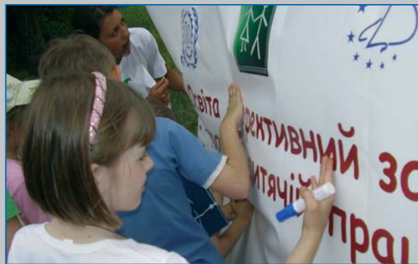
Публічна акція до Всесвітнього дня боротьби за ліквідацію дитячої праці, Донецьк 2008 Street activity for children devoted to WDACL, Donetsk 2008

11 червня 2009 року, за ініціативи Конфедерації вільних профспілок України (КВПУ) та Вільної профспілки освіти та науки, Міжнародного благодійного фонду «Український жіночий фонд» (УЖФ) у співпраці із МОП-ІПЕК та Національним координатором МОП в Україні, було організовано круглий стіл, за участі представників уряду, соціальних партнерів, НУО та міжнародних організацій. Під час заходу було обговорено досягнення України у виконанні Конвенції МОП №182 та перешкоди на шляху її імплементації, зокрема в умовах світової кризи. Під час заходу було проведено церемонію нагородження бти переможців конкурсів плакатів та есе.