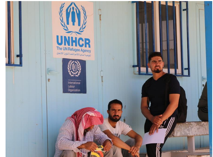
Iniziativa OIL-UNHCR sui servizi per l'impiego all'interno dei campi rifugiati