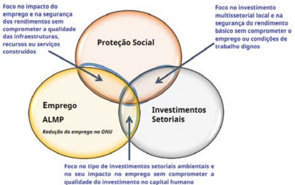
Figura 1: Múltiplos objetivos e compromissos dos programas públicos de emprego 10

Se estes compromissos não forem devidamente considerados na sua conceção, tal pode resultar em regimes improdutivos de “ make-work ” que podem tornar-se em custos equivalentes dos regimes de transferência de rendimentos. Estes compromissos podem ser inevitáveis no início dos programas, mas podem ser minimizadas com monitorização e adaptação contínuas. Os programas têm uma maior probabilidade de sustentabilidade a longo prazo, uma vez que se baseiam em interesses nacionais e utilizam o financiamento público ou, por vezes, combinam-no com o financiamento internacional para a construção de sistemas nacionais.