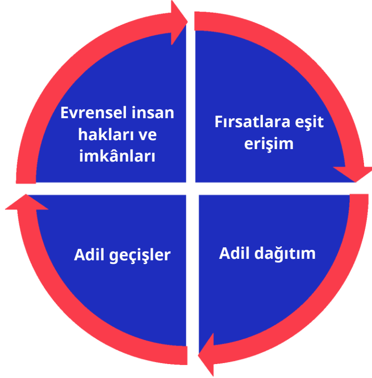
Şekil 1. Sosyal adaletin geliştirilmesi