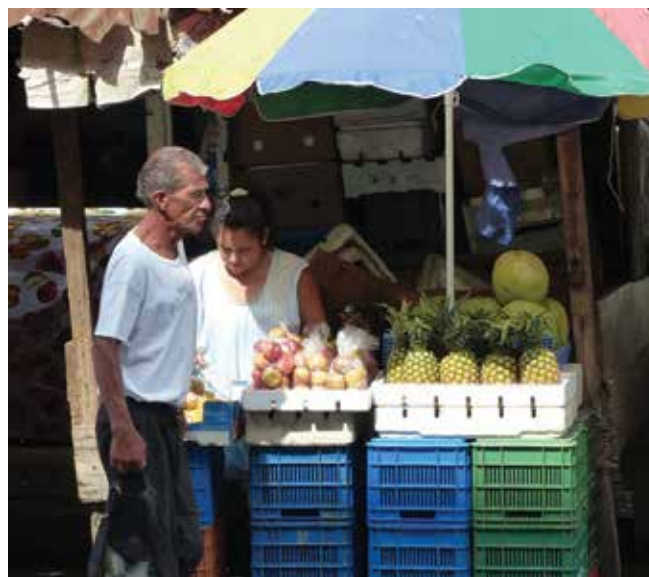
Santa Tecla, San Salvador

Organización Internacional del Trabajo (OIT). 90ª Reunión de la Conferencia Internacional del Trabajo-Ginebra 3-20 de junio 2002. Resolución relativa al trabajo decente y la economía informal.