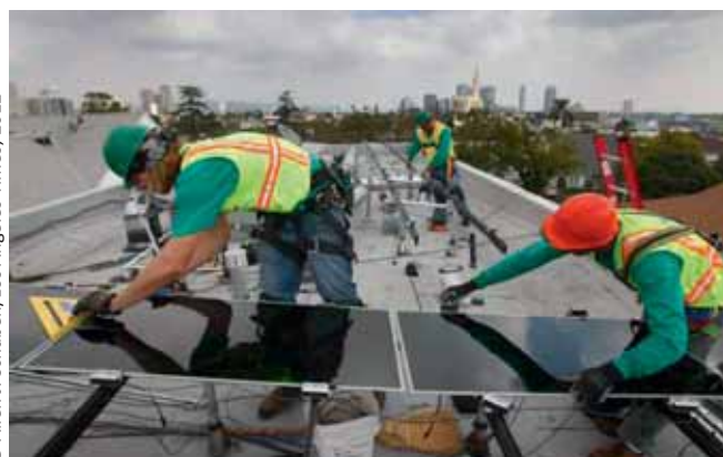
Установка солнечных батарей

Благодаря постоянной общественной поддержке, увеличению инвестиций и расширению производственных мощностей занятость в секторе возобновляемых источников энергии растет быстрыми темпами, которые, похоже, в ближайшие годы будут только возрастать. Объекты энергетики, использующие возобновляемые источники энергии, позволяют создавать больше рабочих мест на единицу установленной мощности, произведенной электроэнергии и вложенных средств, чем электростанции, работающие на органическом топливе. По самым скромным подсчетам, численность занятых в секторе возобновляемых источников энергии во всем мире в настоящее время составляет примерно 4,2 млн чел. Половина этих рабочих мест сосредоточена в подсекторе биотоплива, главным образом в сфере выращивания и сбора сырья, а также в перерабатывающих отраслях промышленности. При быстро растущем интересе к альтернативным источникам энергии вполне вероятно, что в будущем численность занятых в данном секторе будет стремительно возрастать и к 2030 году, возможно, достигнет 20 млн чел. 8 Прогнозы по отдельным странам указывают на наличие значительного потенциала в плане создания новых рабочих мест в предстоящие годы и десятилетия. Особенно заметную роль в разработке технологий использования возобновляемых источников энергии играют такие страны, как Германия, Япония, Китай, Бразилия и Соединенные Штаты, и именно в них пока сосредоточена большая часть занятых в этом секторе. Бо-