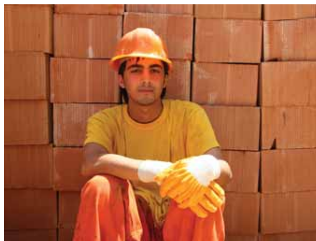
Рабочий-строитель, Азербайджан

Особую опасность при сносе и реконструкции зданий представляет вредное воздействие асбеста, полную защиту от которого обеспечить весьма трудно. Для этого необходимы специальные средства защиты и обучение работников. Работы по сносу и реконструкции зданий могут выполнять только те компании и подрядчики, компетентность которых подтверждается государственными органами. В будущем в строительстве будет происходить постепенный переход на заменители асбеста, чтобы в конечном счете полностью устранить создаваемый им риск для здоровья работников и таким образом обеспечить последовательное «озеленение» строительного сектора и надлежащую охрану труда.