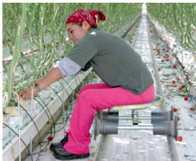
Гидропоника в сельском хозяйстве

Устойчивое сельское хозяйство предполагает сочетание таких аспектов, как гигиена окружающей среды, экономическая жизнеспособность и социальная справедливость, в том числе рациональное использование природных ресурсов. Кроме того, устойчивое сельское хозяйство подразумевает сокращение объемов, замену или полное устранение применяемых агрохимикатов, таких как пестициды, удобрения и др., а также осуществление почвозащитных мероприятий наподобие нулевой обработки почвы, обогащения органическими веществами и водосберегающей ирригации.