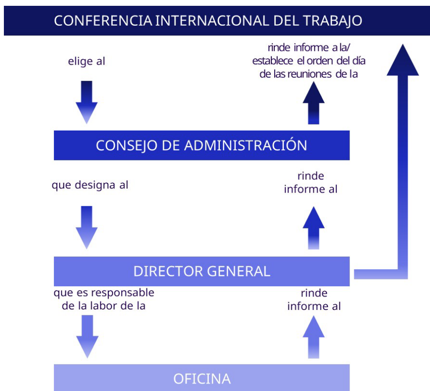
► Gráfico 1. Proceso de gobernanza de la OIT