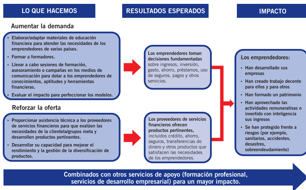
Gráfico 1. Cadena de resultados de las intervenciones de la OIT para aumentar el acceso financiero

Al aumentar su capacidad para utilizar los servicios financieros, podrán lograr mejores resultados empresariales.