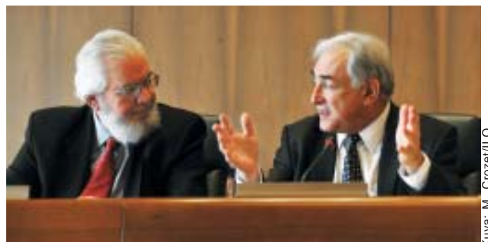
ILO:n pääjohtaja Juan Somavia (vas.) ja IMF:n toimitusjohtaja Dominique Strauss-Kahn

Oikeudenmukaisuuden on oltava se kompassi, joka ohjaa meidät ulos kriisistä. Ihmiset ymmärtävät ja hyväksyvät vaikeitakin valintoja, jos he näkevät, että kaikki jakavat saman kivuliaan taakan. Hallitusten ei pitäisi tehdä valintaa rahoitusmarkkinoiden vaatimusten ja kansalaistensa tarpeiden välillä. Rahoituksellinen ja sosiaalinen vakaus on käytävä käsi kädessä. Muussa tapauksessa, ei vain globaalitalous vaan myös yhteiskunnan sosiaalinen vakaus on vaarassa. ■