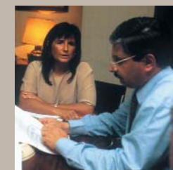
机会均等，待遇公正，择业自主，使每个人发挥最大潜能，为社会作出最大贡献