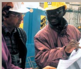
通过履行你的权利，来对与你工作直接有关的事物施加影响