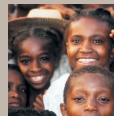
确保儿童有学习和发育的机会

宣言提供了一个独一无二的框架，通过该框架，使国际社会能够为全体人民实现持续和公平的发展。