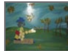
Ayelen Retamosos y Florencia Otalora