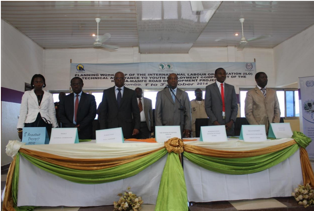
Exécution de l'hymne national