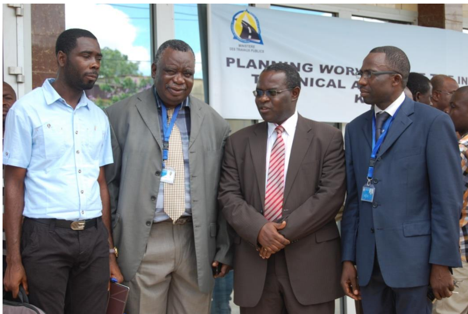
L'équipe du Projet