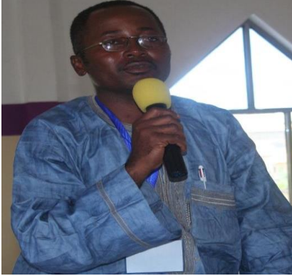
MOTOMA MANGA JAMES DD MINEFOP MEME