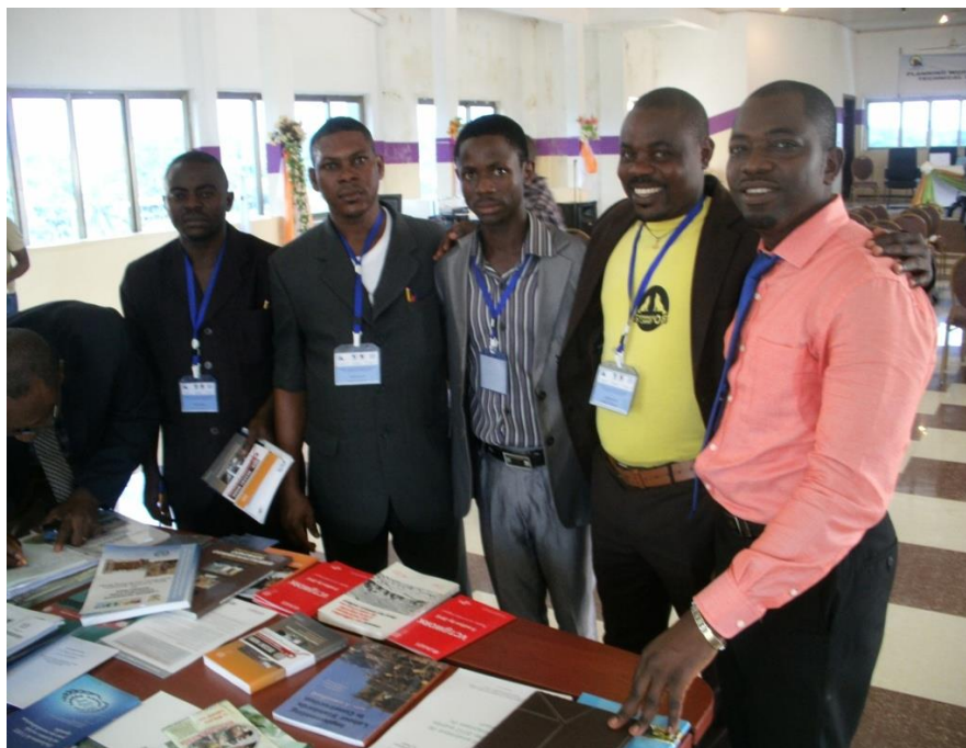
Les jeunes autour de la table d'exposition des livres