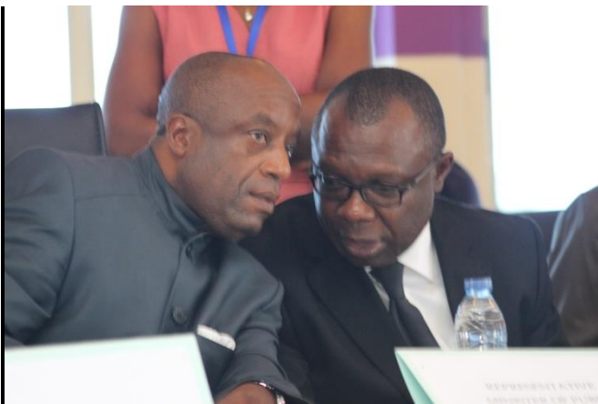
Concertation entre le préfet et un haut responsable du MINTP