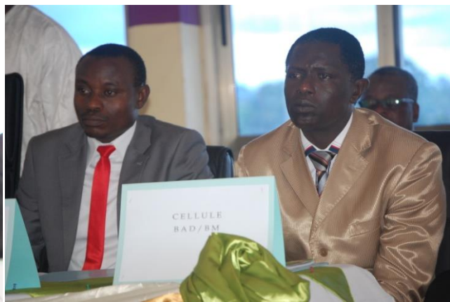
Représentant du MINTP et la Cellule BAD