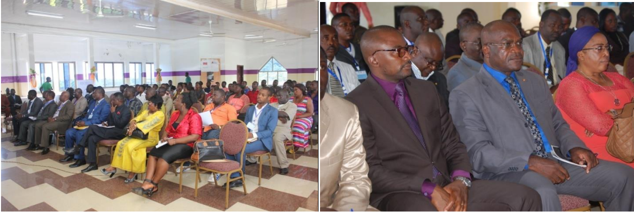
Une vue de participants