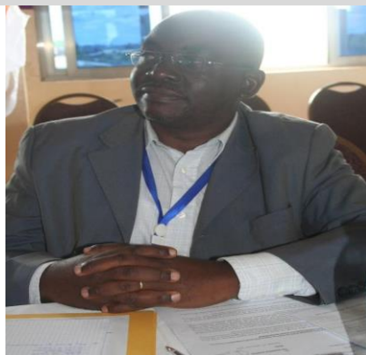
KANGE ELINGE DIRECTOR GA SOWEDA (Buea)