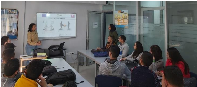
Séance d'information au profit des candidat-e-s à Fès

La cinquantaine de jeunes candidat-e-s marocain-e-s à la migration de main d'œuvre vers l'Allemagne ont achevé leur formation préparatoire au Maroc avec succès. Cette étape préliminaire indispensable à la concrétisation de leur projet de formation professionnelle en alternance en Allemagne a consisté en des cours linguistiques et interculturels d'une durée de six mois, et a été couronnée par l'obtention de la quasi-totalité des candidat-e-s du certificat du niveau B1 en langue allemande.