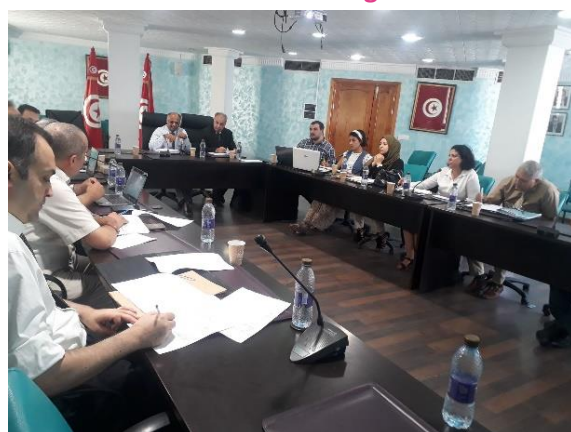
Réunion technique sur l'élaboration de la SNEI et l'intégration de la migration de travail dans la SNEI

La Tunisie est appelée aujourd'hui à répondre de façon stratégique et cohérente aux défis nationaux de l'emploi en recherchant des opportunités tout en harmonisant ses approches dans les domaines du développement, de la formation, de l'emploi et de la migration. Dans le contexte national et international complexe actuel, l'élaboration d'une Stratégie nationale de l'emploi à l'international et de protection des droits des travailleurs migrants (SNEI) semble primordiale pour une meilleure gouvernance du marché du travail à l'international. La SNEI repose sur un ensemble de valeurs structurant la vision des pouvoirs publics, et traduisant ses choix nationaux, en dialogue avec les partenaires sociaux, et ses engagements avec la communauté internationale. Cette vision globale s'articule autour d'une approche de droit, systémique, transversale, participative, basée sur les principes de la bonne gouvernance et évolutive, intégrant différents horizons temporels au niveau structurel et conjoncturel.