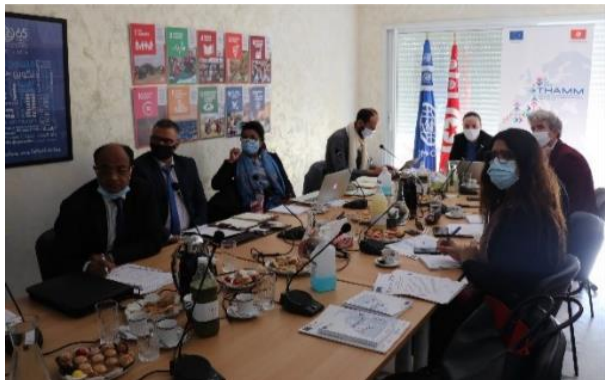
Webinaire régional sur les recommandations de Montréal sur le recrutement

Dans le cadre du renforcement de capacités des acteurs gouvernementaux en matière de recrutement éthique, l'OIM a organisé un webinaire régional, le 26 novembre 2020, en présence des principaux partenaires de THAMM, et ce afin de leur présenter les recommandations de Montréal sur le recrutement. Ces 55 recommandations sont le fruit de la conférence mondiale qui s'est tenue à Montréal en juin 2019, et qui fournissent aux gouvernements des conseils divers et pratiques pour permettre une réglementation plus efficace du recrutement international et de la protection des travailleurs migrants. Le webinaire a rassemblé une quarantaine de participant.e.s, dont des fonctionnaires gouvernementaux de la Tunisie, du Maroc et de l'Égypte, afin de faciliter les échanges entre pairs en termes de réglementation du recrutement et de protection des travailleurs migrants.