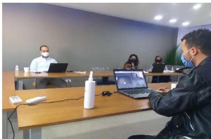
Entretiens de sélection THAMM