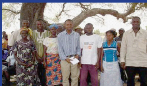
Miembros del Comité local de vigilancia de Tamale, Ghana.

Gracias a los esfuerzos desplegados por los CLV y la agencia ejecutora del proyecto LUTRENA, Jekataanie, se ha interceptado e integrado a la formación profesional a más 250 niños que habían sido reclutados ilegalmente para que trabajaran en plantaciones de Côte d'Ivoire. Esta formación fue organizada gracias a los esfuerzos de los CLV y a la colaboración de maestros artesanos. Estos maestros reciben un estipendio, y los niños reciben formación en materia de soldadura, mecánica, agricultura, tintado de textiles, sastrería y costura, y horticultura.