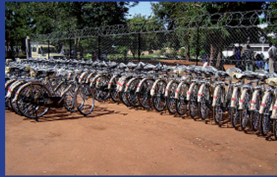
72 bicicletas preparadas para su distribución al CALTI en el distrito de Urambo para los programas de vigilancia y seguimiento del trabajo infantil establecidos en las aldeas.

Existe un potencial para integrar rápidamente el SSTI en las instituciones de gobernanza local del país, debido al programa de reforma en curso de la administración local. La descentralización está teniendo lugar mediante la política “Descentralización a través de la delegación”. Desde 2008 hasta la actualidad (2010), el Gobierno ha desplegado esfuerzos deliberados para acelerar el proceso de descentralización, que supone reservar recursos para el desarrollo de las capacidades institucionales para las operaciones realizadas por la administración local.