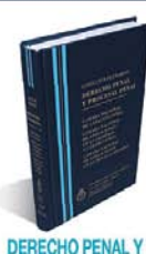
DERECHO PENAL Y PROCESAL PENAL