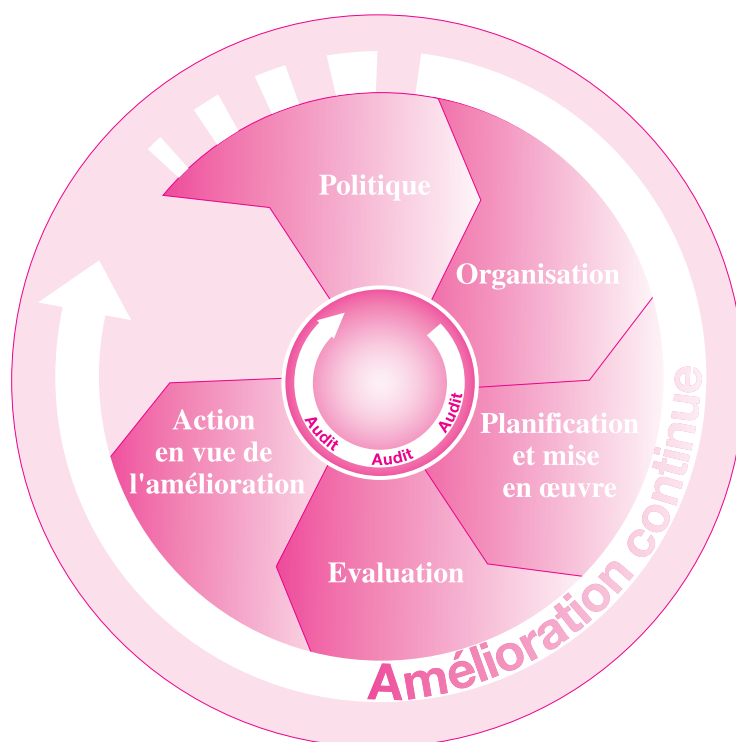
Figure 2. Éléments principaux du système de gestion de la sécurité et de la santé au travail

La santé et la sécurité au travail, y compris le respect des prescriptions de sécurité et de santé au travail applicables dans la législation et réglementation nationales, sont la responsabilité et le devoir de l'employeur. L'employeur devrait jouer un rôle de premier plan dans les activités relatives à la sécurité et à la santé au travail dans l'organisation et faire le nécessaire pour établir un système de gestion à cet effet. Ce système devrait prévoir les éléments essentiels — politique, organisation, planification et mise en œuvre, évaluation et action en vue de l'amélioration — présentés dans la figure 2: