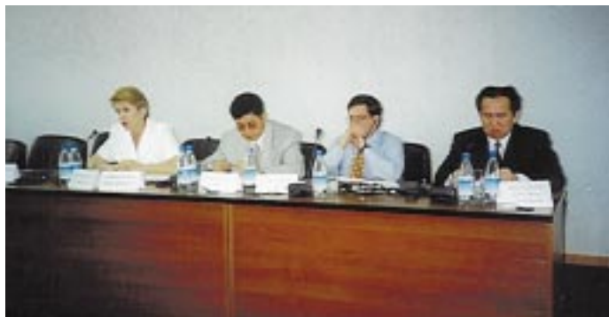
В 1999 году в России, Белоруссии, Грузии и Казахстане было проведено множество встреч по теме перестройки предприятий с участием представителей предприятий, местных органов власти и социальных партнеров.

Имеем удовольствие информировать Вас, что Бюро Международной организации труда (МОТ) в Москве, Министерство труда и социального развития Российской Федерации, Федерация независимых профсоюзов России и Координационный совет объединений работодателей проводят в Москве (гостиница «Россия») в период с 4 по 6 октября 1999 года серию Технических совещаний и Международную Конференцию по теме: Преодоление негативных последствий, возникших в переходный период в Российской Федерации.