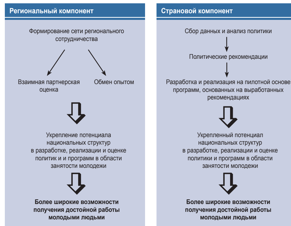
Рисунок 1. Стратегия реализации партнерства по занятости молодежи

сотрудничества в сфере занятости молодежи. Одной из особенностей проекта является взаимная партнерская оценка, в ходе которой страны-участницы имеют возможность изучить и оценить политику друг друга, что будет содействовать их взаимному сотрудничеству и обмену передовыми практиками.