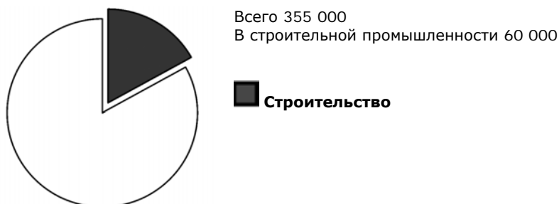
Схема 4. Оценка смертности на производстве в мировом масштабе (2003)