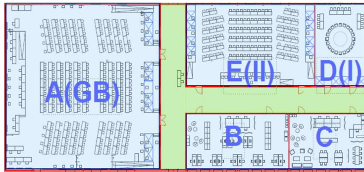
R1NORTH TEMPORARY BUILDING