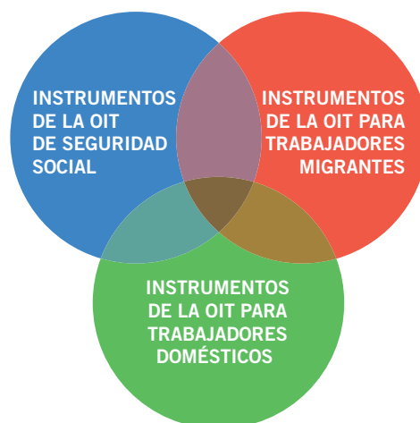
Figura 2. Disposiciones comunes en virtud de instrumentos de la OIT para las personas trabajadoras domésticas migrantes

La Recomendación sobre la transición de la economía informal a la formal de 2015 (núm. 204), incluye a los trabajadores domésticos como un grupo especialmente vulnerable a los más graves déficits de trabajo decente en la economía informal, reconociendo que los trabajadores domésticos y trabajadores domésticos migrantes a menudo carecen de un estatus regular de empleo o contrato formal. La Recomendación promueve la creación y el mantenimiento de un piso de protección social nacional; y una extensión progresiva a todos los