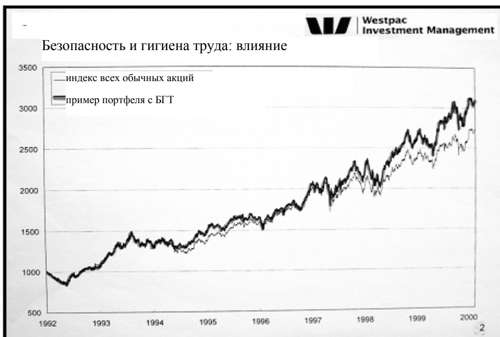
График 1. Опыт НКБГТ по оценке влияния БГТ на стоимость ценных бумаг

работодателей, но держатели акций, являясь инвесторами, также затронуты экономическими аспектами БГТ. Если БГТ повышают прибыль, они должны повышать и рыночную стоимость акций корпораций. В 2002 году Национальная комиссия Австралии по безопасности и гигиене труда решила проверить это предположение и с этой целью сравнила эволюцию цены гипотетически составленного портфеля ценных бумаг корпораций с хорошими показателями в области БГТ с развитием рынка ценных бумаг Австралии в целом; 18 на графике 1 четко видно, что безопасность увеличивает добавленную стоимость.