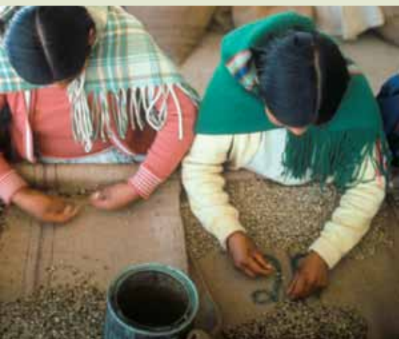
Mujeres seleccionando café en una cooperativa en el distrito de Puno, Perú