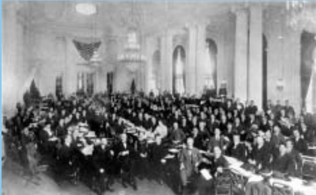
Valtuuskunnat Kansainvälisen työkonferenssin ensimmäisessä yleisistunnossa Washington DC:ssä 1919.

(Kaikki kuvat ILO:n kuva-arkistosta, ellei kuvan yhteydessä toisin mainita)