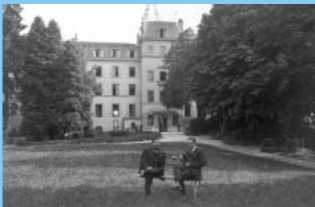
ILO:n apulaisjohtaja Harold Butler (vas.) ja järjestön ensimmäinen pääjohtaja Albert Thomas nauttivat lepohetkeä ILO:n ensimmäisen päämajarakennuksen edessä Pregnyssä, Sveitsissä. Rakennus toimii nykyisin Punaisen Ristin kansainvälisen komitean päämajana.