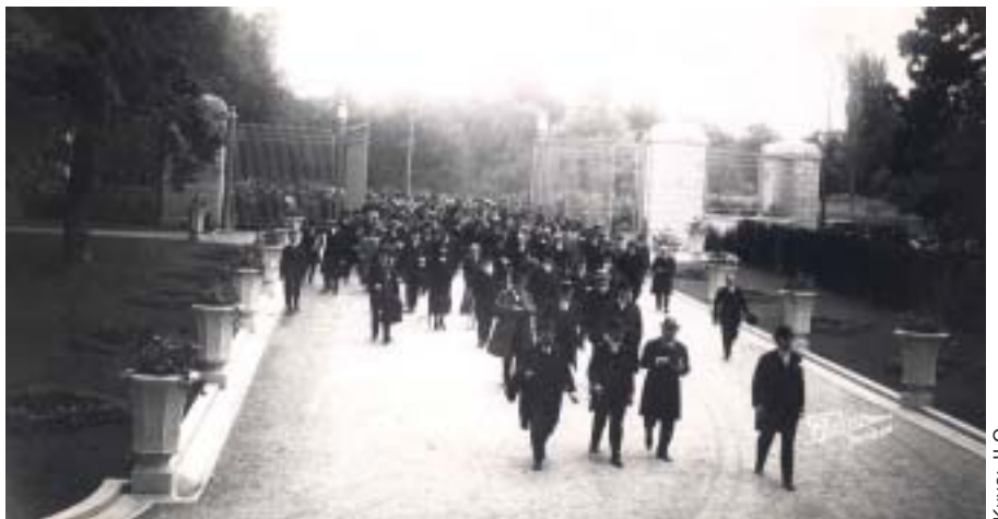
ILO:n ensimmäisen toimitalon vihkiäiset 6. kesäkuuta 1926 Genevessä.

ILO juhlii 90-vuotistaivaltaan keskellä maailmantalouden yhtä pahimmista kriiseistä kautta historian. Jälleen kerran tarvitaan ILO:n ydinviestiä sosiaalisesta oikeudenmukaisuudesta, kun maailma taistelee ”epätasapainoisen, epäreilun ja kestäättömän” globalisaation seurausten kanssa. ■