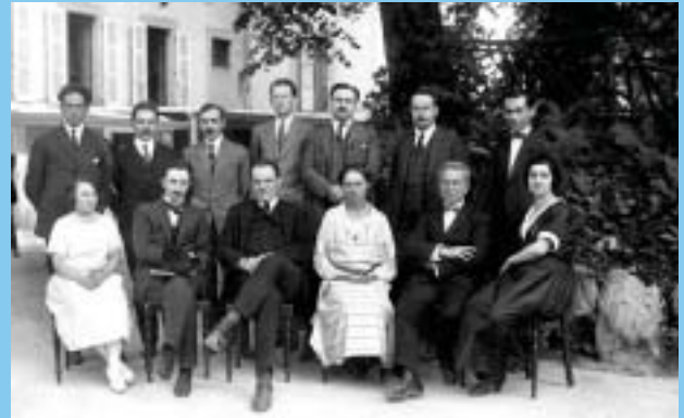
ILO:n henkilökunta Kansainvälisessä työkonferenssissa 1919.