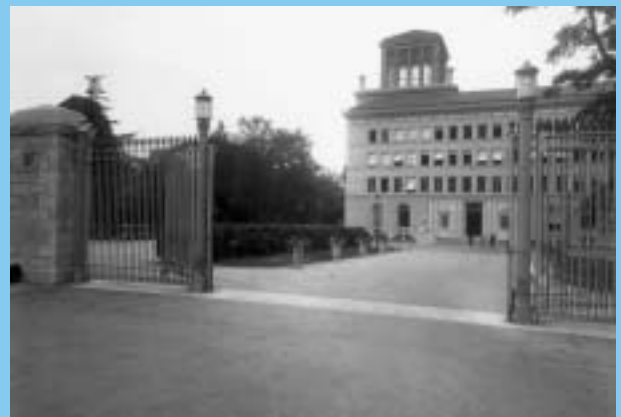
ILO:n ensimmäisen toimitalon suunnitteli sveitsiläinen Georges Epitoux. Talo oli ILO:n käytössä vuosina 1926–1974.