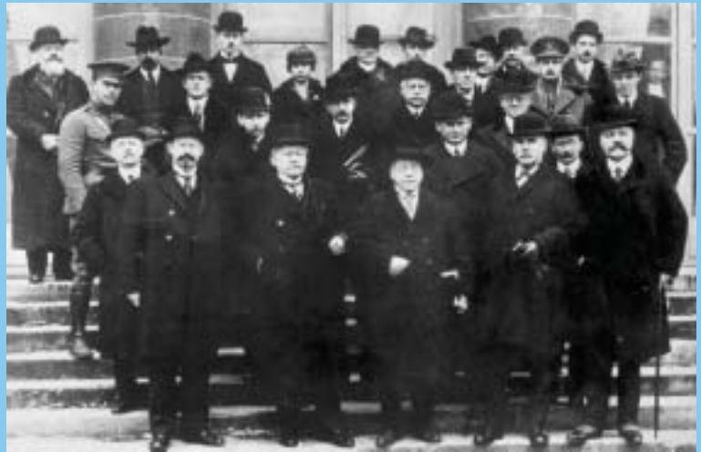
Kansainvälisen työläinsäädännön komissio Pariisiin rauhankonferenssissa helmi-maaliskuussa 1919. Komissio laati ILO:n peruskirjan, joka myöhemmin sisällytettiin Versaillesin sopimukseen.

Ensimmäisen maailmansodan raunioille perustetun Kansainvälisen työjärjestön tehtäväksi tuli tukea rauhantilaa rakentamalla maailmaan sosiaalista oikeudenmukaisuutta. Järjestön peruskirjan luonnosteli Kansainvälisen työläinsäädännön komissio, johon kuului kaksi edustajaa kustakin tuon ajan viidestä suurvallasta – Yhdysvalloista, Britanniasta, Ranskasta, Italiasta ja Japanista – sekä edustajat Belgiasta, Kuubasta, Puolasta ja Tšekkoslovakiasta. ILO:n syntysanat kirjattiin suursodan päätteeksi solmittuun Versaillesin sopimuksen artiklaan 392, jossa luvataan perustaa Kansainvälinen työjärjestö osaksi Kansainliiton organisaatiota. Koska Geneve oli jo valittu Kansainliiton isäntäkaupungiksi, siitä tuli myös Kansainvälisen työjärjestön kotipaikka.