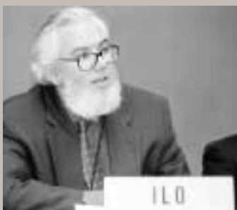
Juan Somavia, Directeur général du BIT

A la tête du Bureau international du Travail (BIT) se trouve un Directeur général désigné par le Conseil d'administration. Depuis 1919, la direction générale du BIT a été assurée successivement par: