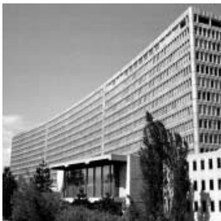
Le siège du BIT à Genève