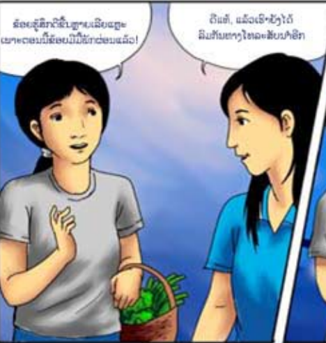
ວັນອາທິດ...

ຂ້ອຍຮູ້ສຶກດີຂຶ້ນຫຼາຍເລີຍເຖງະ ເພາະຕອນນີ້ຂ້ອຍມີໜຶ່ງຝ່ອນແລ້ວ!