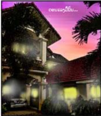
ຕອນລາງມື້ນີ້...