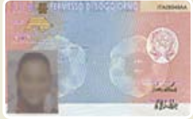
रुकने के लिए परमिट