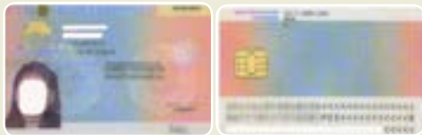
रुकने के लिए यूरोपीय संघ का दीर्घावधि परमिट