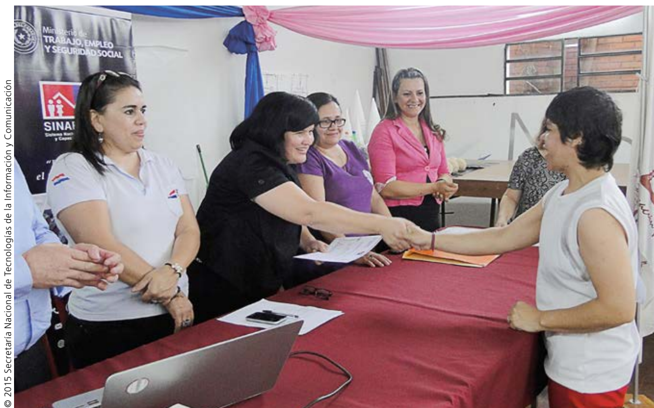
© 2015 Secretaría Nacional de Tecnologías de la Información y Comunicación