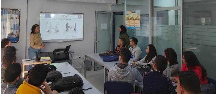
© GIZ / Séance d'information au profit des candidat-e-s à Fès

La cinquantaine de jeunes candidat-e-s marocain-e-s à la migration de main d'œuvre vers l'Allemagne ont achevé leur formation préparatoire au Maroc avec succès. Cette étape préliminaire indispensable à la concrétisation de leur projet de formation professionnelle en alternance en Allemagne a consisté en des cours linguistiques et interculturels d'une durée de six mois, et a été couronnée par l'obtention de la quasi-totalité des candidat-e-s du certificat du niveau B1 en langue allemande.