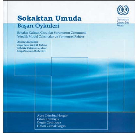
Sokaktan Umuda Başarı Öyküleri ISBN 92-2-814151-4