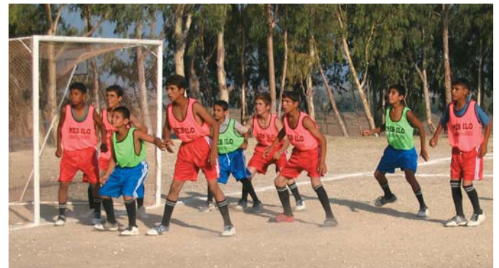
Karataş Projesi Sportif Etkinlik