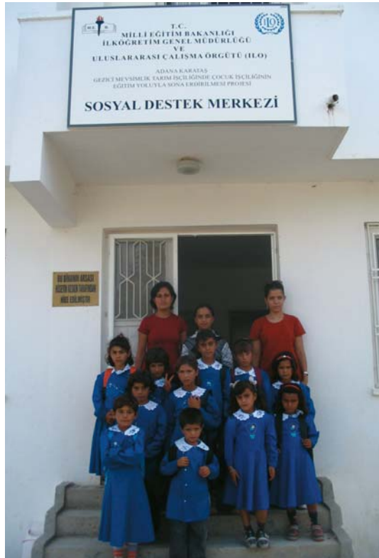
Adana Karataş Sosyal Destek Merkezi