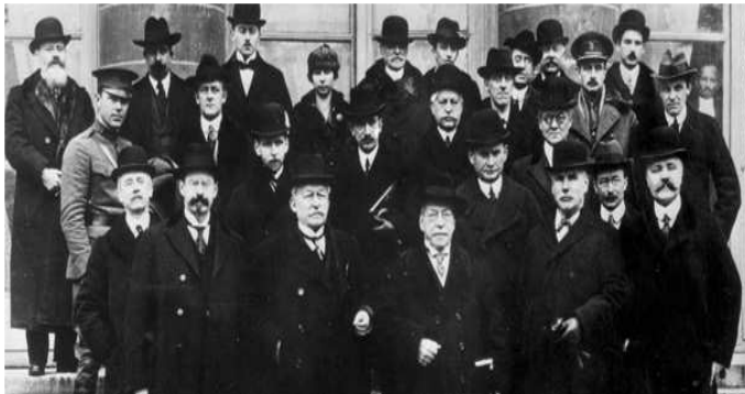
Comisión de Legislación Internacional del Trabajo (febrero-marzo (1919)

La Constitución de la OIT contenía ideas ya experimentadas en la Asociación Internacional para la Protección Internacional de los Trabajadores, fundada en Basilea, Suiza, en 1901.