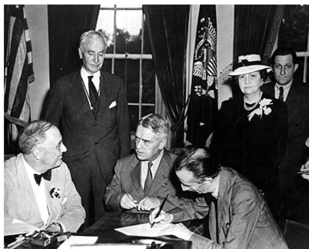
El Director General de la OIT, Edward J. Phelan firmando la Declaración de Filadelfia en la Casa Blanca, 1944

Debemos recordar que la OIT fue la primera agencia especializada en asociarse a las Naciones Unidas en 1946, poco después de la creación de esta última.