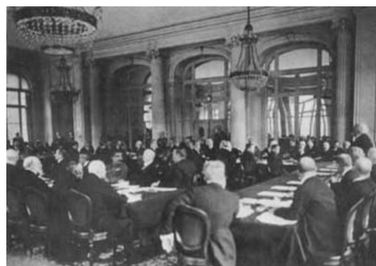
Sala de los Espejos del Palacio de Versalles durante las negociaciones del Tratado de Paz de Versalles, 1919

El Preámbulo de la Constitución de la OIT dice que las Altas Partes Contratantes estaban “movidas por sentimientos de justicia y humanidad así como por el deseo de asegurar la paz permanente en el mundo...”