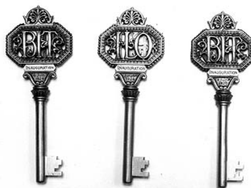
Las tres llaves símbolo del tripartismo en la ceremonia de inauguración del edificio de la OIT, 6 de junio de 1926

En 1926, la Conferencia Internacional del Trabajo introdujo una innovación importante con miras a supervisar la aplicación de las normas. De esta forma, se creó una Comisión de Expertos compuesta por juristas independientes, encargada de examinar las memorias de los Gobiernos sobre la aplicación de los Convenios ratificados por ellos . Cada año, esta Comisión presentaba su propio informe a la Conferencia.