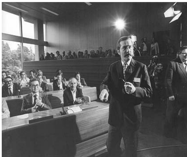
Lech Walesa, líder del sindicato Solidaridad, en la sesión plenaria de la 67 Conferencia Internacional del Trabajo en Ginebra. Junio

La OIT desempeñó un papel importante en la emancipación de Polonia, al darle su apoyo total a la legitimación del sindicato Solidarnosc, basándose en el respeto del Convenio n° 87 sobre Libertad Sindical, que Polonia había ratificado en 1957.