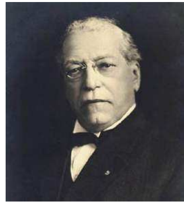
Samuel Gompers, Presidente de la AFL

Su Constitución fue elaborada entre enero y abril de 1919 por la Comisión de Legislación Internacional del Trabajo. Esta Comisión estaba constituida por representantes de nueve países (Bélgica, Checoslovaquia, Cuba, Estados Unidos, Francia, Italia, Japón, Polonia, y el Imperio Británico) y estaba encabezada por Samuel Gompers, Presidente de la American Federation of Labour (AFL).