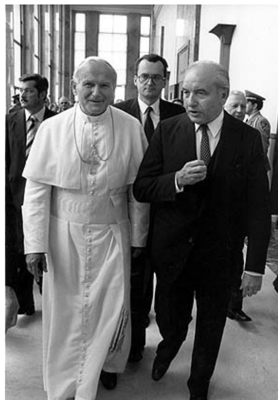
15 de junio de 1982, el Papa Juan Pablo II interviene en la 68 Conferencia Internacional del Trabajo, promoviendo la dignidad del trabajo

Durante la Dirección General del belga Michel Hansenne, que asumió su cargo en 1989 y que condujo a la OIT después del fin de la Guerra Fría, la Organización puso énfasis en la importancia de colocar la justicia social en el centro de las políticas económicas y sociales internacionales y en la lucha por los Derechos Laborales Fundamentales y la Libertad .