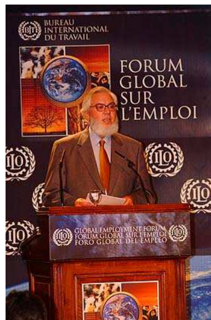
Discurso del Director General del OIT, Juan Somavia, en la Sesión de Apertura del Foro Global para el Empleo, Ginebra

De las nueve iniciativas conjuntas planteadas por Naciones Unidas, para afrontar la crisis, acelerar la recuperación y construir una globalización justa e inclusiva, que permita una economía sostenible y desarrollo social y ambiental para todos, la del Director General es una de las más importantes. En ella, la OIT tendrá un papel de liderazgo.