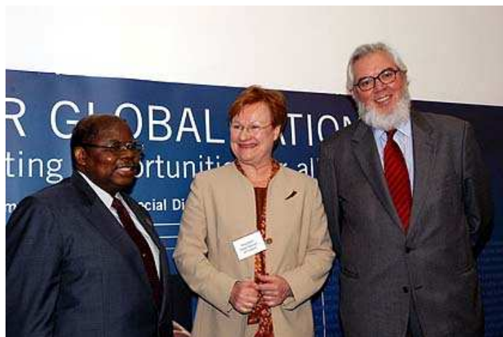
Presentación del Informe de la Comisión Mundial sobre la Dimensión Social de la Globalización, Londres, 24 de febrero de 2004. De derecha a izquierda: Benjamín W. Mkapa, Presidente de la República de Tanzania, Tarja Jalonen, Presidenta de Finlandia y Juan Somavia, Director General de la OIT

En 2004, la Agenda de Trabajo Decente, recibió un importante respaldo de la Comisión Mundial sobre la Dimensión Social de la Globalización . Esta Comisión se creó en 2002 para estudiar el modo de ampliar el acceso a los beneficios de la globalización y para garantizar que esta contribuya a lograr sus objetivos sociales. El informe de la Comisión, copresidida por Benjamín William Mkapa, Presidente de Tanzania y Tarja Jalonen, Presidenta de Finlandia, identificó 57 medidas para promover una globalización equitativa, y argumentaba que el Trabajo Decente debería ser un objetivo global, integrado en las políticas nacionales como internacionales.