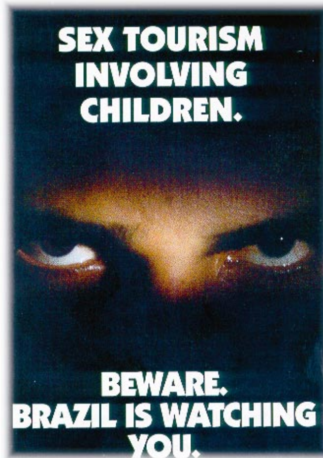
Brazilian Tourist Board

provincial con el apoyo técnico adicional del IPEC. Se prevé que su ejecución favorecerá, a largo plazo, una acción eficaz y sostenible.