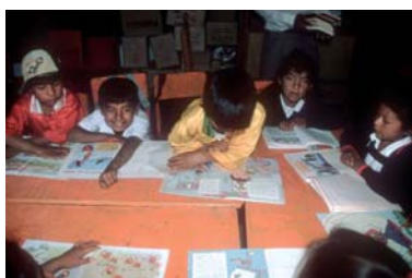
Ученики местной школы читают книги, приобретенные для них МОТ. Моллехуака, Перу

от эксплуатации и жестокого обращения. Они отстаивают право работников на удовлетворительное вознаграждение, тем самым уменьшая зависимость малообеспеченных семей от труда своих детей. В дополнение к ведению переговоров от лица своих взрослых членов организации работников могут прилагать дополнительные усилия к тому, чтобы дети не работали, а учились. Существующее в структуре МОТ Бюро по деятельности работодателей осуществляет гендерно-чувствительную программу технического содействия, финансируемую правительством Норвегии и направленную на наращивание потенциала работодателей и их организаций в области борьбы с детским трудом 11 .