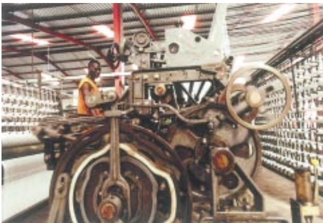
漁網を生産する企業。 タンザニア、 ダルエスサラームの 輸出加工区。

グローバルな生産システムが拡大したことにより、海外直接投資（FDI）と競争に関する新しいルールが必要とされている。すべての利害・権利・責任を考慮し、開発に資するバランスのとれたFDIのための多国間枠組みが必要である。これを実現するためには、一般的に認められた討論の場で交渉が行われなければならない。