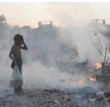
デリー郊外でのくず拾い

【ニューデリー】2004年2月にインド政府は、米国労働省および国際労働機関(ILO)の協力を得て、10の危険産業で働く約8万人の児童労働者を対象とした4,000万米ドルの計画を発表した。