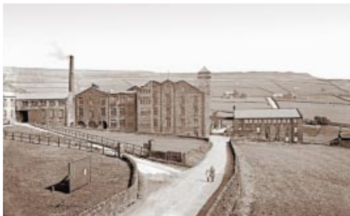
1910年頃の エーカー工場 (英国ヘブデン ブリッジ)