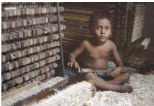
シヴァカシのマッチ工場での労働

「児童労働はなくてもすむものです」とソマビア事務局長は述べた。「簡単に解決できる問題ではないことはわかっています。しかし戦略を立てる場合、それは国の具体的な事情を反映し、政治的意思に支えられたものでなければなりません。私たちはやはり、親たちに仕事を、子どもたちに教育を、若い人たちに機会を、という目標を堅持し続けなければなりません。」