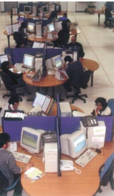
チュニジアの コールセンター

のバランスに配慮した統合的な政策提案を段階的に展開していくことである。最初のイニシアチブでは、世界的な成長、投資、雇用創出の問題を取り上げ、関係する国連機関、世界銀行、国際通貨基金（IMF）、世界貿易機関（WTO）、ILOが参加する。その他のイニシアチブの優先分野には、ジェンダー平等、女性のエンパワメント、教育、保健、食糧の安全保障、人々の居住問題などがある。