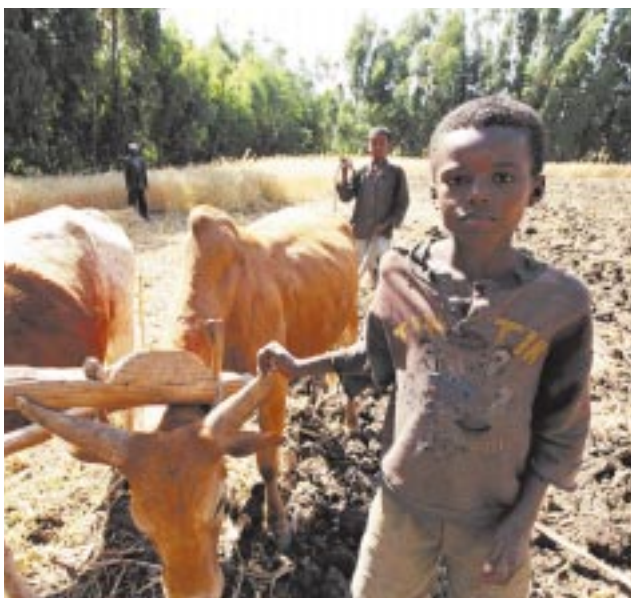
エチオピアにおける地方の貧困。この一家全員でも1日1.5米ドルの収入しかない。