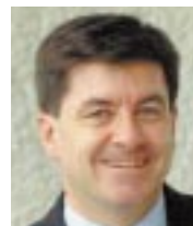
ガイ・ライダー氏