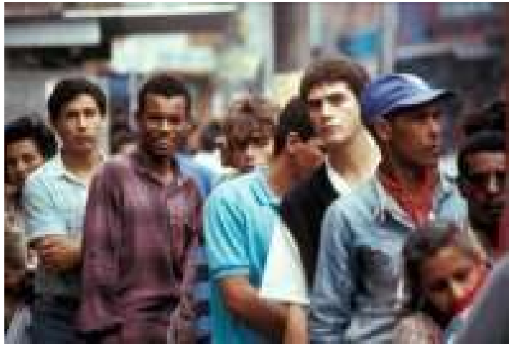
Giovani disoccupati in Brasile

Nel 2003, l'indice di disoccupazione giovanile globale era del 14,4 per cento, con un incremento in 10 anni del 26,8 per cento. Il fenomeno è più allarmante nel Medio Oriente e nel Nord Africa (25,6 per cento), seguito dai Paesi dell'Africa sub-sahariana (21 per cento), le economie in transizione (18,6 per cento), America Latina e paesi industrializzati (13,4 per cento), e Asia dell'Est (7 per cento).