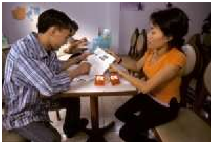
Prevenzione contro l'AIDS a scuola in Vietnam