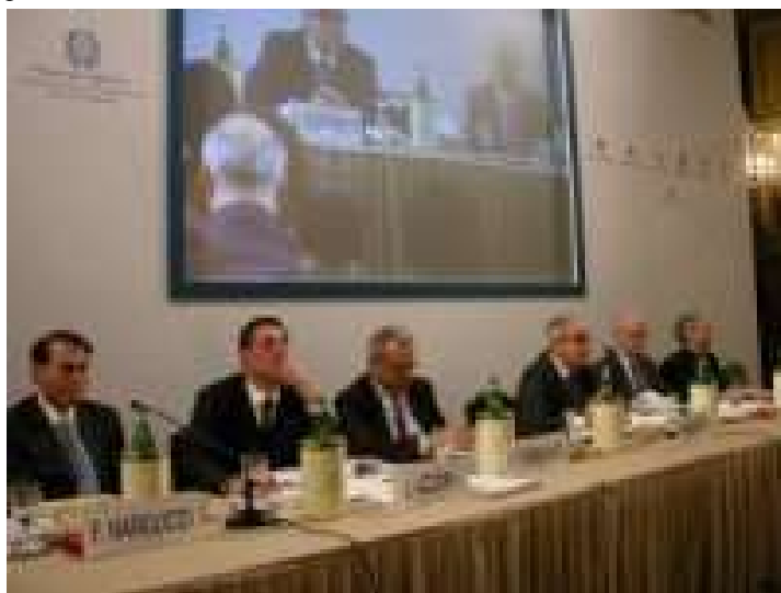
Seminario del progetto PPTIE

Il progetto PPTIE nasce con l'obiettivo di promuovere la collaborazione tra gli Italiani all'estero e le Regioni del Mezzogiorno, creando le basi per accordi di partenariato tesi a proiettare le attività territoriali — a livello istituzionale, economico, culturale e sociale — nel contesto di un « sistema italiano nel mondo ». In sostanza, gli Italiani all'estero diventano grazie al PPTIE, « agenti di sviluppo territoriale » nelle regioni di provenienza.