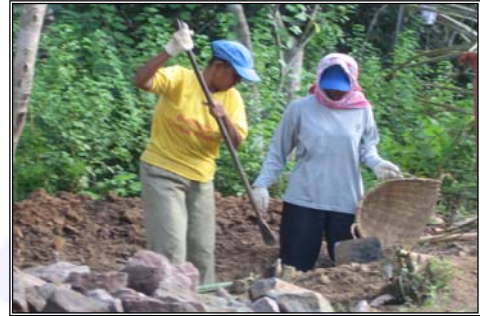
Foto 2: Perempuan bekerja di Prmbangunan Gedung BLK Sabang, Juni 2006

Penundaan dalam proses pemulihan dan rekonstruksi juga telah disebabkan oleh administrasi tenaga kerja yang cukup lemah. Sebagian besar pekerjaan yang baru tercipta bersifat informal dan berada di sektor pembangunan, yang mengarah pada sebuah sistem upah yang terbagi-bagi dan tingkat resiko pekerjaan yang tinggi. Oleh karenanya, Program ILO di Aceh telah meneruskan upaya pembangunan kapasitas kelembagaannya untuk mitra-mitra tripartit ILO dan organisasi non pemerintah. Serangkaian kursus pelatihan dan lokakarya administrasi ketenagakerjaan telah dilaksanakan. Sampai saat ini, upaya tersebut telah berhasil dalam mempertemukan perwakilan dari dinas ketenagakerjaan di tingkat provinsi dan kabupaten serta organisasi pekerja setempat guna berdiskusi dan meningkatkan keterampilan dan kesadaran mereka mengenai kesehatan dan keamanan kerja, administrasi tenaga kerja dan masalah hubungan tenaga kerja.