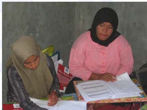
Foto 9: Partisipasi perempuan dalam pelatihan SYB sebelum Memulai Perusahaan, Mei 2006

Berangkat dari pengalaman internasional ILO dalam menanggapi krisis, komponen Pembangunan/Pemulihan Ekonomi Lokal menerapkan dua program yang berbeda di daerah-daerah geografis terpilih yaitu Sabang, Aceh Besar, dan Teluk Dalam. Kedua program ini adalah pertama, pemulihan ekonomi lokal dan, kedua, pembangunan ekonomi lokal. Dalam kedua kasus, penekanan diberikan kepada partisipasi aktif dari masyarakat dan para pemangku kepentingan, serta penciptaan sinergi untuk berbagai aktivitas ILO berdasarkan kebutuhan dan kepentingan masyarakat setempat.