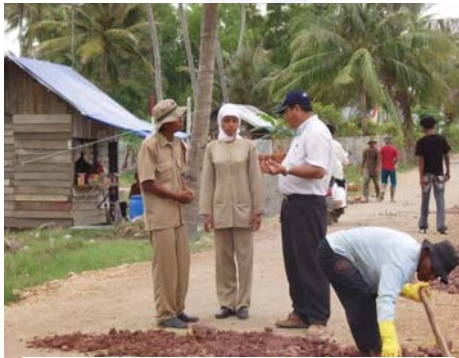
Foto 6: Magang para insinyur Dinas Pekerjaan Umum Aceh Besar, Februari 2006

Jalanan di banyak bagian Aceh dan Nias tidak dipelihara dengan baik bahkan sebelum rusak parah akibat tsunami. Program ILO di Aceh menerapkan skema Rehabilitasi Infrastruktur Pedesaan Berbasis Sumber Daya Lokal untuk memberikan tiga hasil strategis. Yang pertama