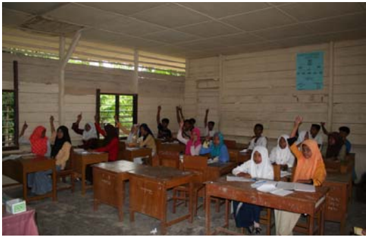
Foto 8: Anak-anak dalam kelas "Pelatihan Kecakapan Hidup", Aceh Besar, April 2006

17 tahun dalam bidang pekerjaan kayu, keterampilan otomatis, kerajinan tangan, pembuatan kasur, sablon, dan layanan kecantikan di Banda Aceh dan Aceh Besar.