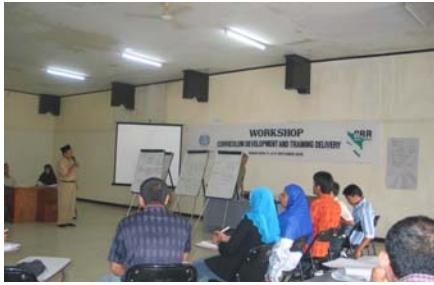
Foto 3: Pelatihan BRR-ILO tentang Pengembangan Kurikulum, Banda Aceh, Juli 2006

dengan kualitas konstruksi yang rendah, komponen Pelatihan Kejuruan telah membentuk sekelompok pelatih keliling ( mobile trainers ) untuk mengidentifikasi kesenjangan