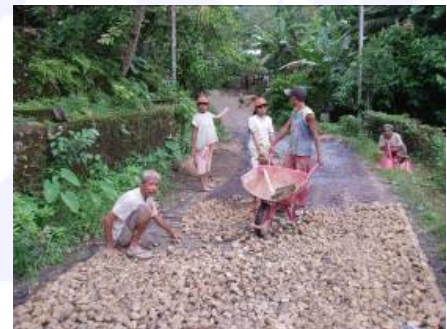
Foto 7: Rehabilitasi infrastruktur berbasis sumber daya lokal, Gunung Sitoli, Maret 2006

Proyek perintis untuk rehabilitasi infrastruktur berbasis sumber daya lokal, didanai oleh UNDP-ERTR dan OCHA, telah diselesaikan pada bulan Juli 2006. Dengan pendanaan dari Dana Multi Donor untuk Aceh dan Nias, Program ILO di Aceh tengah meningkatkan pendekatan LBIR dan memperluas kerjanya ke Aceh Besar, Pidie, Bireun, Gunung Sitoli dan Teluk Dalam.