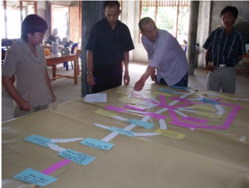
Foto 10: Lokaraya tentang Penilaian Keunggulan Daya Saing Lokal, Nias, Juni 2006

pengembangan perusahaan milik perempuan, dan elemen keuangan mikro telah diselenggarakan di kecamatan-kecamatan terpilih. Sebagai hasilnya, sejumlah perusahaan kecil dan mikro yang dapat menciptakan lapangan kerja telah terbentuk dengan dukungan dana dari ILO dan pinjaman dari MFI lokal.