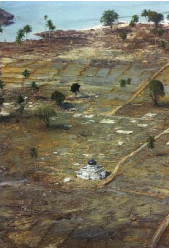
Hanya Mesjid yang tersisa di daerah Meulaboh.