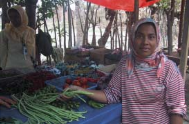
Wajah-wajah perempuan Aceh.