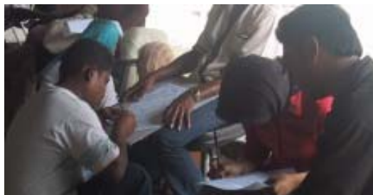
Puluhan ribu pencari kerja sedang mendaftar di LKMNAD Banda Aceh.