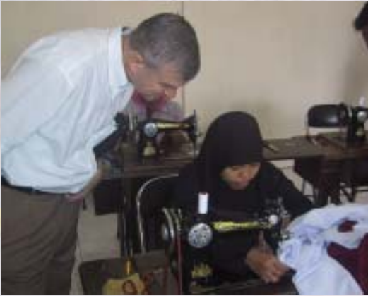
Alan Boulton, Direktur ILO Jakarta, sedang berbincang-bincang dengan salah satu peserta pelatihan menjahit yang diselenggarakan ILO-IPEC di Aceh.

disediakan program pelatihan keterampilan dan mata pencaharian. Program tersebut saat ini dijalankan Disnaker, Banda Aceh, melalui BLK, serta ditujukan untuk memberikan remaja berusia 15-17 tahun keterampilan praktis yang dapat membantu mereka memperoleh pekerjaan yang tidak berbahaya dan eksploitatif. Program, yang akan berjalan selama delapan minggu, akan menyediakan kursus-kursus singkat mengenai keterampilan menjahit, pertukangan dan komputer, serta secara keseluruhan melatih sekitar 192 anak. Saat kunjungan Menteri Tenaga Kerja dan Transmigrasi baru-baru ini ke Aceh, Menteri Fahmi menyaksikan langsung kegiatan pelatihan dan berbincang dengan peserta.