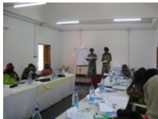
Photo 1 : Première restitution des travaux de groupe