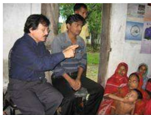
L'équipe de RADOL sur le terrain

Depuis 1989, RADOL a développé des projets allant de programmes de logements à bon marché à des formations agricoles. Grâce à l'assistance technique, RADOL va renforcer un consortium qui pilotera les projets de micro-assurance et validera l'offre de produits.