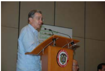
Président Dr Uribe au podium

Munich Re Foundation, Fasesolda et le Fides ont organisé récemment la Conférence annuelle sur la micro-assurance qui s'est tenue à Cartagena, en Colombie. L'évènement a été inauguré par le Président colombien, Dr Álvaro Uribe, qui a déclaré : "en Colombie, la micro-assurance a le potentiel pour atteindre même les plus pauvres parmi les pauvres. Développer l'éducation sur l'assurance et la sensibilisation sur les mécanismes de gestion des risques est crucial. Les gens doivent comprendre que l'assurance est la première option pour gérer les situations d'urgence qu'il s'agisse d'un choc personnel tel que des problèmes de santé, une crise financière ou une catastrophe naturelle. Au lieu d'aller emprunter, ils devraient penser à l'assurance en premier."