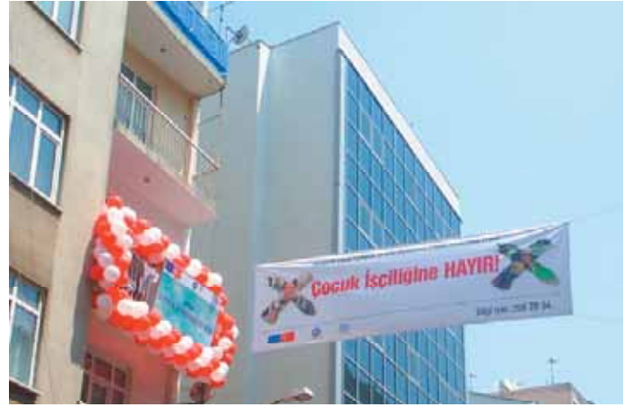
6-7 Temmuz 2006 Sinop İl Eylem Komitesi toplantısı ve Koordinasyon Ofisi açılışından görüntüler

Scenes from 6-7 July 2006 Sinop PAC Meeting and Coordination Office opening ceremony