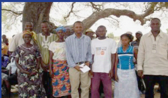
Membres d'un comité local de vigilance de la région de Tamale au Ghana.

Suite à la création et à la présence des CLV, des mesures innovatrices, axées sur les résultats ont été prises en vue de créer des programmes durables de lutte contre la traite dans des communautés à risque. Au Ghana, la loi sur la traite des êtres humains de 2005 prévoit un fonds spécial pour soutenir la formation des personnes liées à des