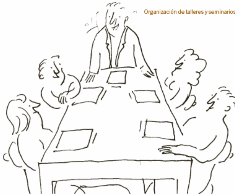
Organización de talleres y seminarios.